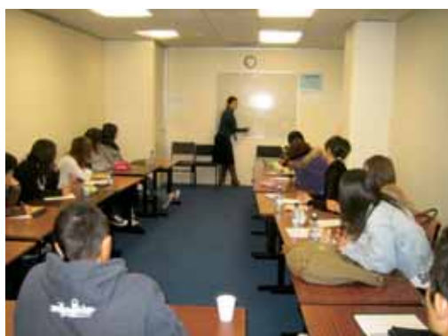
図3 フィティレイア・コミュニティー・ポリテクニクの英語訓練コース授業風景

んどのポリテクニクでは外国人向けの英語訓練コース(図3)が設けられているため、英語研修を併せたインターンシップが可能であり、本科生の語学研修も、平成18年度と19年度にフィティレイア・コミュニティー・ポリテクニクで実施されている。しかしながらインターンシップの実施後、その実施内容等を検討した結果、①インターンシップの内容(学生の専攻とインターンシップ自習テーマのミスマッチ)、②受け入れ先の指導体制、③受け入れ先のアカデミックな指導能力など、さまざまな問題点が明らかとなり、平成20年度の実施に向けて受け入れ先の再検討を行うこと