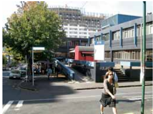
図2 フィティレイア・コミュニティー・ポリテクニク(オークランド校)

本来インターンシップとは、教育機関に所属する学生が、学生であるうちに企業等で就労体験を積む事であるとされており、その就労体験は、学生達が学習した事を実践的に応用する機会であるとともに、職業に関してより明確な目標意識をもつための重要な教育課程と位置づけられている。日本では歴史の浅い制度であるが、アメリカにおいては100年近い歴史をもち、現在では全米約700校の大学がインターンシップ制度を教育プロセスの中に取り入れ単位として認定するとともに、約70%の学生が就職前に就労体験を積んでいると言われるほど普及している 2) 。本校専攻科では、高専生が一般的に弱いとされる英語力の養成と、アカデミックな実習を含んだインターンシップを同時に実施する試みとして、平成19年度に、協定校であるニュージーランドのフィティレイア・コミュニティー・ポリテクニク(オークランド校)(図2)で、語学研