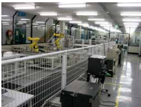
図5 ウェスタン・シドニー大学工学部の実習・実験施設

オーストラリアの3つの大学を訪問調査した結果、平成20年度には4名の専攻科1年生がウロンゴン大学で3ヶ月間の長期インターンシップを実施する事となった。実習のテーマは、本校専攻科生の研究内容および希望する内容を受け入れ側に提示し、可能な限りこ