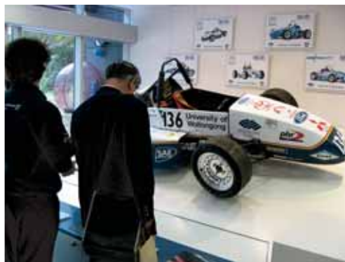
図4 ウロンゴン大学のFormula SAEレーシングカー

次に訪問したウロンゴン大学は、オーストラリア東部ニューサウスウェールズ州に位置し、シドニーの南方約80キロメートルの海岸部に位置し、オーストラリア国内の大学でも最も美しいキャンパスを持つと言われる総合大学である。工学部は、土木、建築、機械、電気、電子、情報、物質、環境等の教育プログラムを実施している 6) 。また学生生活動として学生の自動車レースFormula SAEに積極的に参加し、大学の積極的な支援のもとオーストラリア国内大会では常に上位の成績を収め、2003年には世界大会で優勝するなど優秀な成績を収めている(図4)。Formula SAEとは1981年にアメリカで始まった自動車の競技大会で、学生た