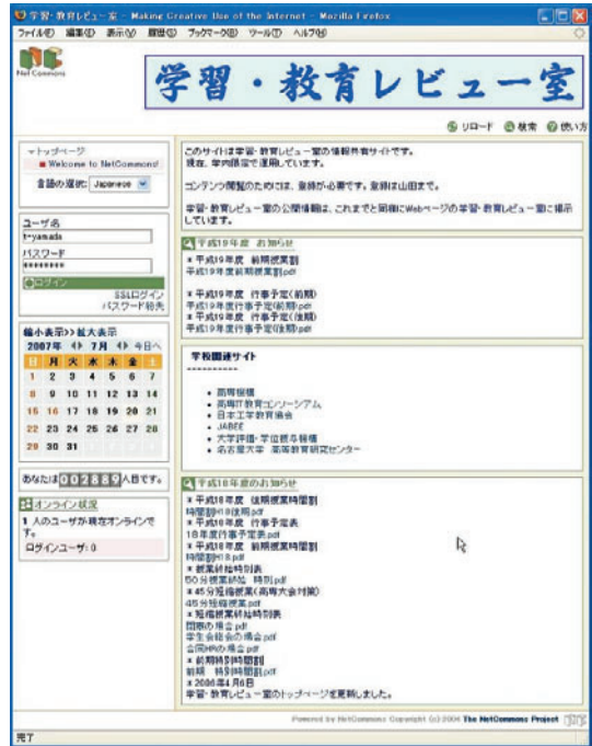
図 6 学内委員会のトップページ

このシステムで卒業研究の指導・管理を2年間実施してきたが、比較的良好に卒業研究日誌記録がされてきた。問題点としては、セキュリティ上校内限定サイトとして運用しているため、学生が日誌などへ学外からアクセスできないことである。この問題点を解消し、更に携帯電話からのアクセスが出来るようになれば、活用度の向上が期待できる。