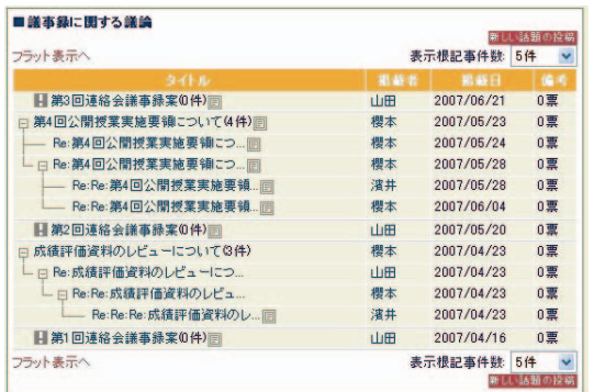
図 8 掲示板利用の例