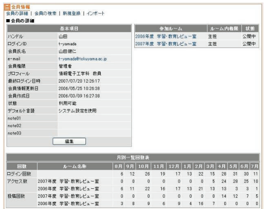
図 7 会員情報のページ