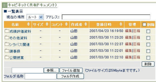
図9 キャビネット利用の例