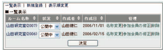
図3 ルーム管理画面