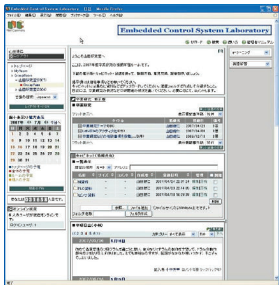
図4 卒業研究のルーム